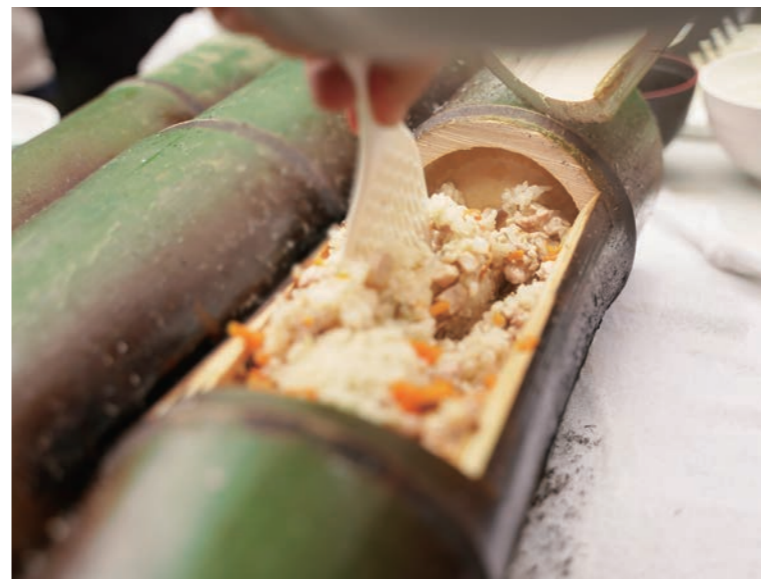
竹筒BBQ / 竹筒 BBQ