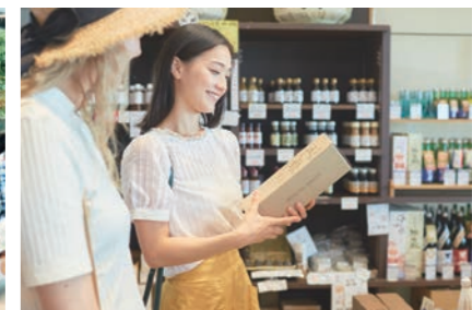
道の駅 発酵市場 道之驛 發酵市場