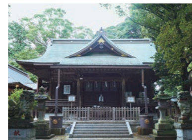
神崎神社 本堂 神崎神社 本堂