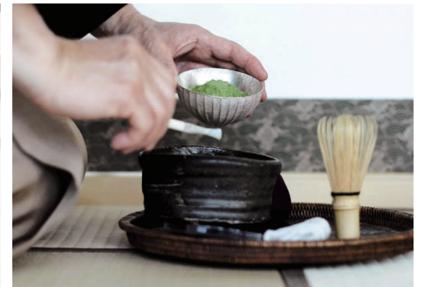
茶道体験 / 茶道體驗