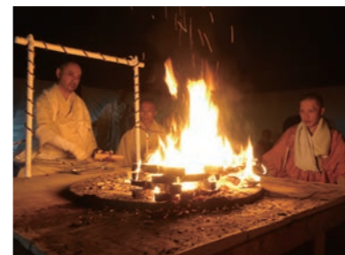
神崎神社 護摩焼き 神崎神社 護摩焚