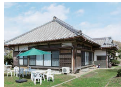
椿 HOUSE 外觀 椿 HOUSE 外觀