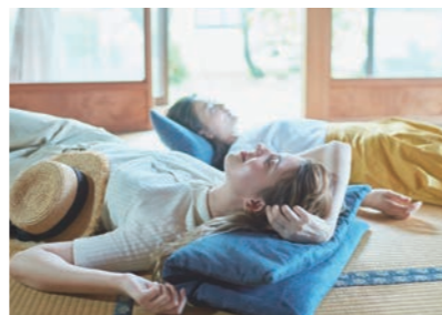
畳で休憩 在榻榻米上休憩