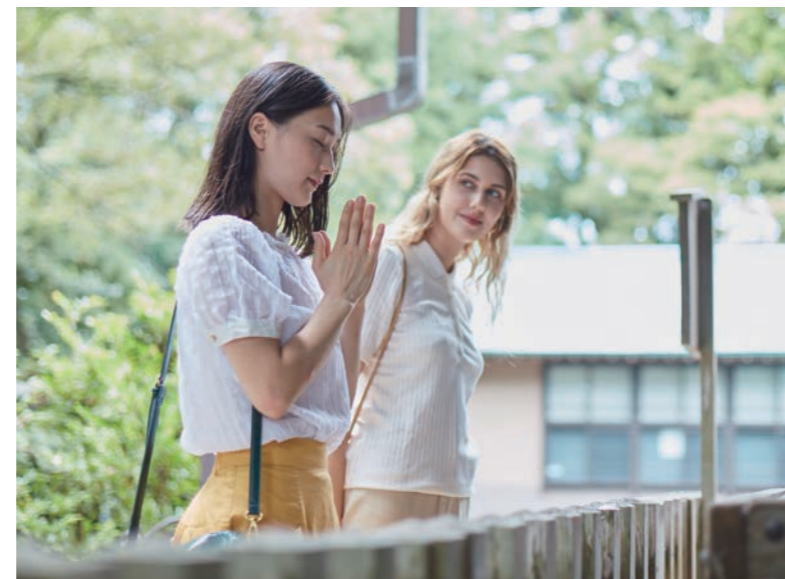
神崎神社 参拝 / 神崎神社 参拜