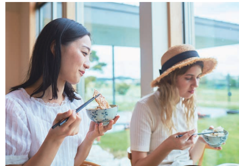
道の駅 発酵の里こうざき「レストランオリゼ」 道之驛 發酵之里神崎「Restaurant Orize」

以擁有300年以上歷史的「鍋店」及「寺田本家」兩大酒蔵為中心，每年3月所舉辦的「酒蔵祭」吸引了5萬人以上到訪，相當熱鬧。