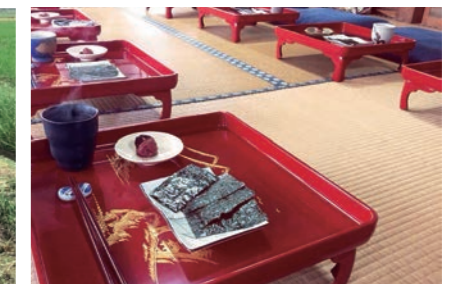
ファスティング合宿 斷食合宿